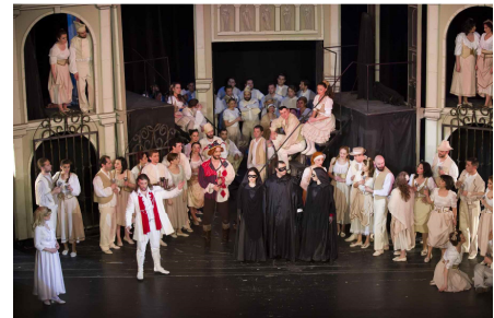
Scenă din primul act