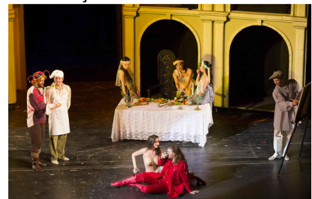
Scenă din actul al doilea